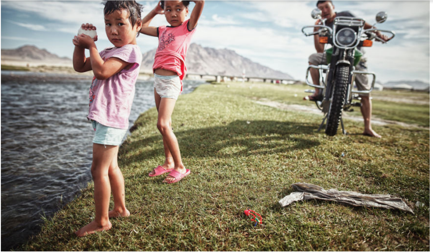
15. El corredor de Wakhan en Tayikistán