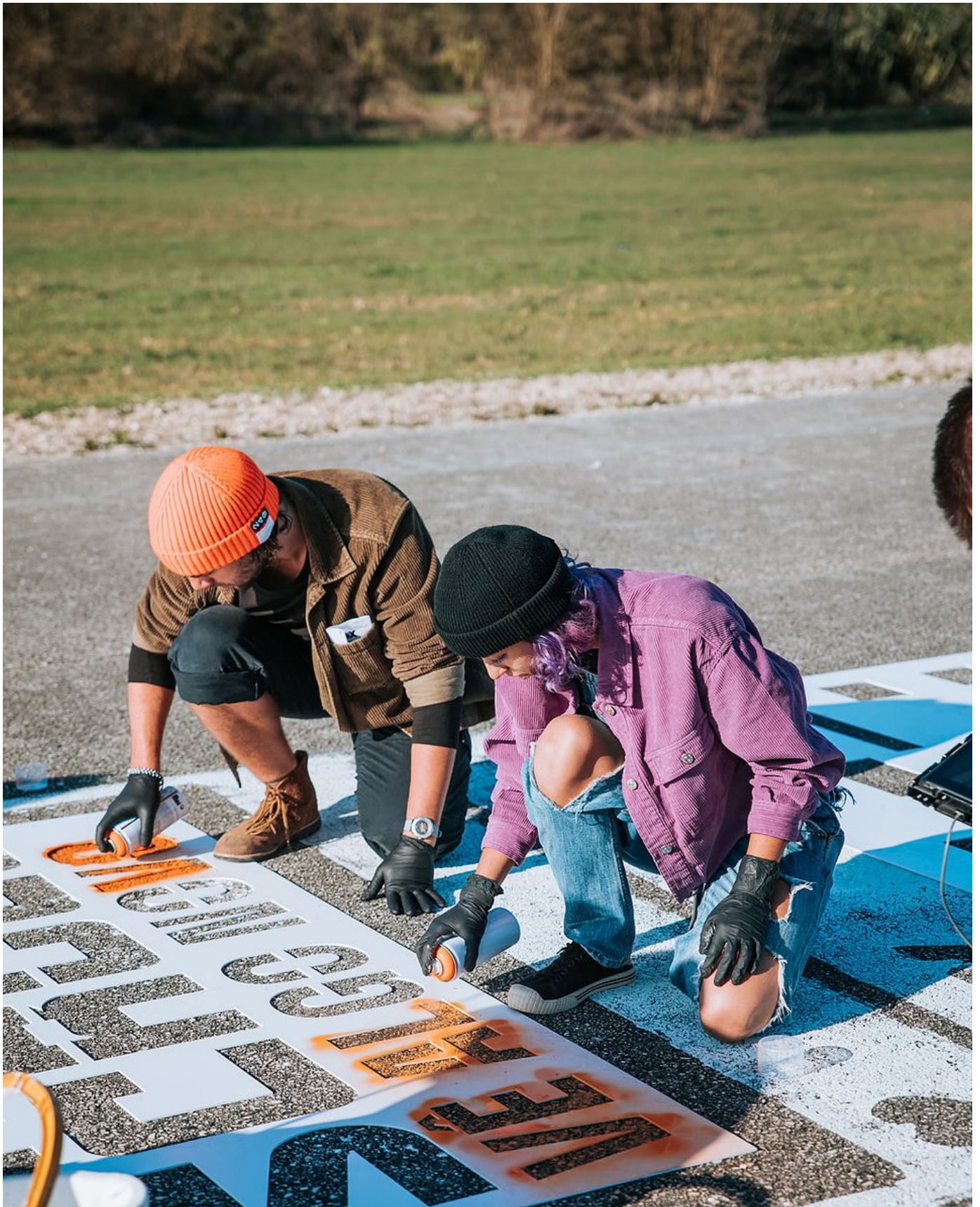
FOX cria um scroll nunca visto